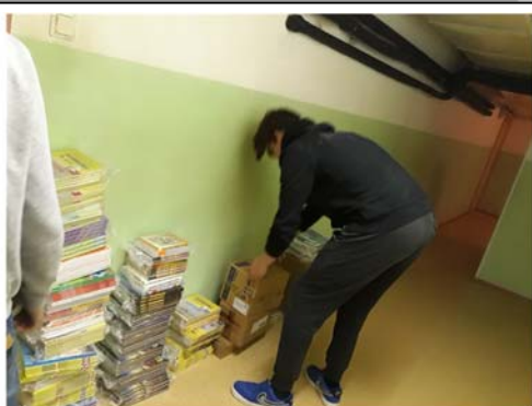
No sākuma grāmatas bija pagrabā.