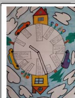
Valtera veidotais pulkstenis