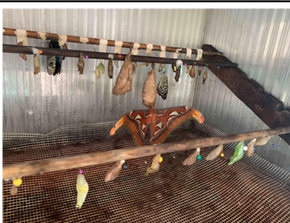
1.attēlā. Ieraudzījām, kā šķiļas tauriņi 2.attēlā. Tauriņu mājas eksemplārs Tērvetē

Kristers Svoks, 5.b klase, Alises Jerānes foto