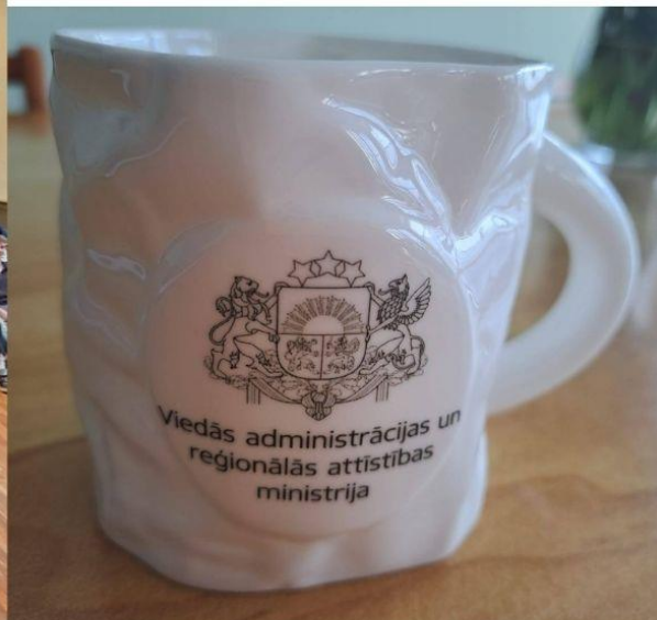
Attēli no skolas arhīva